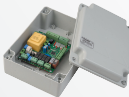
ERTB70/2DC/BOX Armoire de commande pour moteur Brushless