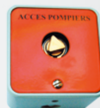
S00819ES14 CONTACTEUR POMPIER SAILLIE TRIANGLE de 14mm