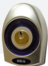
S23103050 CONTACTEUR SEA À CLÉ 2 contacts en saillie