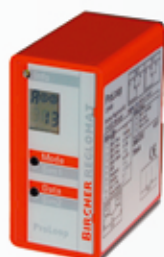
S224485 AMPLIFICATEUR DE BOUCLE BIRCHER 230V 2 voies avec support