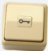
S333A BOUTON POUSSOIR plastique 1 contact NO