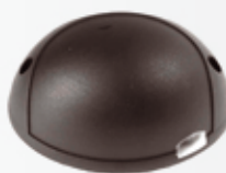
SDM30P1 RADAR DE DÉTECTION réglage horizontal 90° vert 45° portée 10m maxi 12-24V