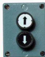
SGDT2 BOÎTE GEB MÉTALLIQUE 1 bp à encastrer