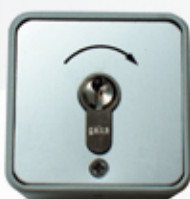
S450503 CONTACTEUR GEB MÉTALLIQUE À CLÉ 2 contacts en saillie