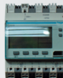
SEG293B HORLOGE ANNUELLE 1 contact 220V