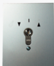
S450505 CONTACTEUR GEB MÉTALLIQUE À CLÉ 2 contacts à encastrer