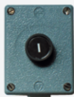
SGDT1 BOÎTE GEB MÉTALLIQUE 1 bp en saillie