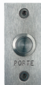
SCBPNONF BOUTON POUSSOIR CDVI INOX 1 bp NO-NF à encastrer